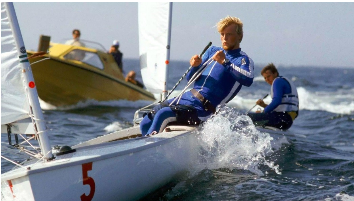
ЭСКО РИЧАРТ, ПОБЕДИТЕЛЬ МОСКОВСКИХ ОЛИМПИЙСКИХ ИГР 1980 В КЛАССЕ ФИНН, ТАЛЛИН