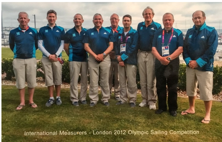
International Measurers - London 2012 Olympic Sailing Competition

ЮРИЙ НА ОЛИМПИЙСКИХ ИГРАХ В ЛОНДОНЕ 2012Г.