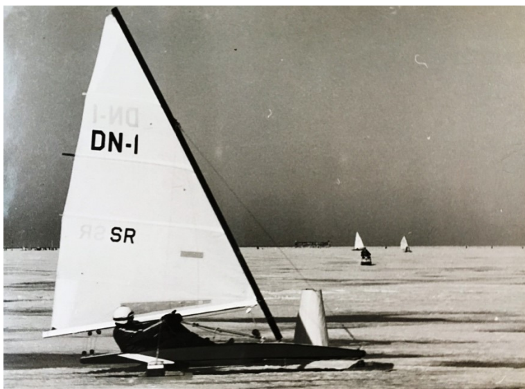
БУЕРА ЮРИЯ: МОНОТИП SR5 И DN-1. ФОТО: ЧАСТНАЯ КОЛЛЕКЦИЯ

Это означает, что Юрий был первым во всем Советском Союзе кто вышел на построенном в СССР буере класса DN. Его номер на парусе SR 1.