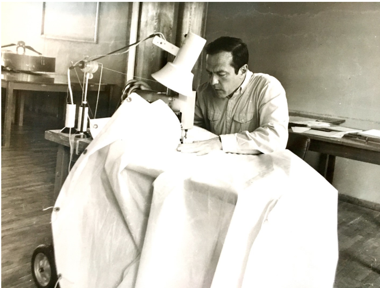
ПЕРВЫЕ ПОПЫТКИ ПОШИВА ПАРУСОВ.