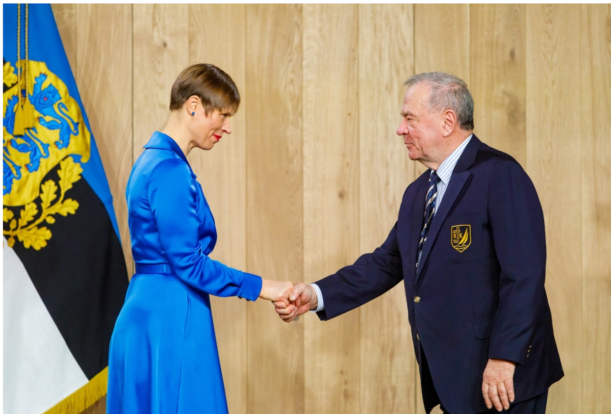
ЮРИЙ ПОЛУЧАЕТ ОРДЕН БЕЛОЙ ЗВЕЗДЫ 5-Й СТЕПЕНИ ИЗ РУК ПРЕЗИДЕНТА ЭСТОНИИ.

прицепе. Фелип вышел из автобуса и подошел ко мне поговорить. И он, и его охранник помнили мое имя и откуда я родом. Мы поболтали несколько минут. И я поболтал с Константином II из Греции в очереди в столовую. Он выиграл олимпийское золото на драконе в 1960 году в Риме.”